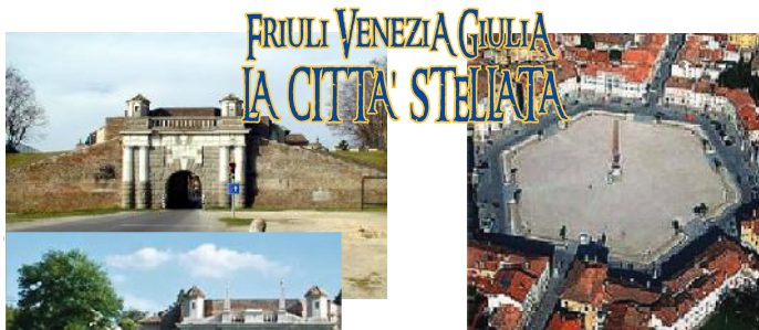
Le tre porte monumentali che permettono l'accesso alla città (Porta Cividale, Porta Udine, Porta Aquileia)